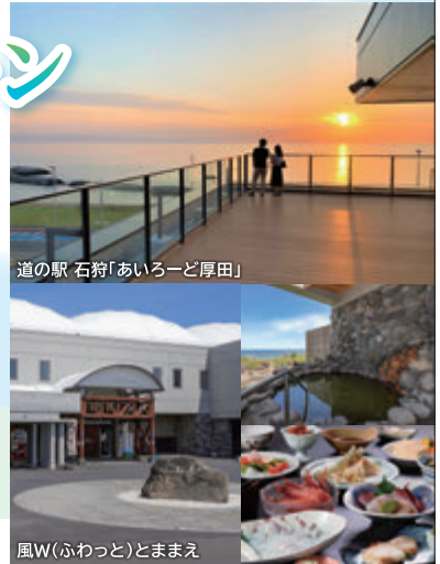
道の駅 石狩「あいりーど厚田」