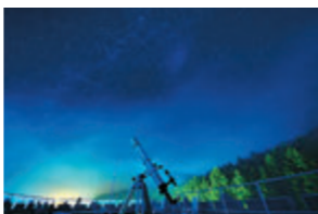
毎日20時から星空観測会を開催。満天の星空を楽しんで。

2019年12月に「芦別温泉スターライトホテル」の日帰り入浴エリアが「おふるcafé星遊館」としてリニューアル。オシャレな館内にはコミックや雑誌が5,000冊以上、フリーコーヒーやFree Wi-Fi、コワーキングスペースなど無料アイテムをご用意。体育館やキッズスペースも併設されており、1日中ゆっくり楽しめる。星空露天風呂・セルフウリュウなど温泉施設も充実。カフェ&レストランは、地元食材にこだわった料理を提供している。8月までは、露天風呂ピーチやハワイアンカフェが楽しめるイベントも開催中。自由気ままに自分時間を過ごしてみては。