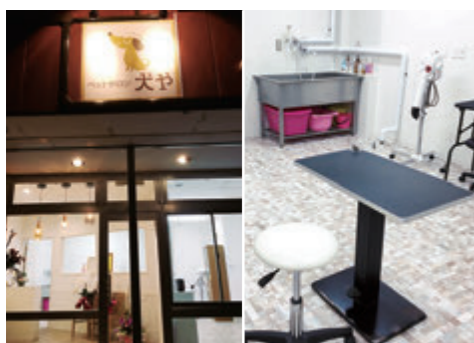
ペットサロン 犬や