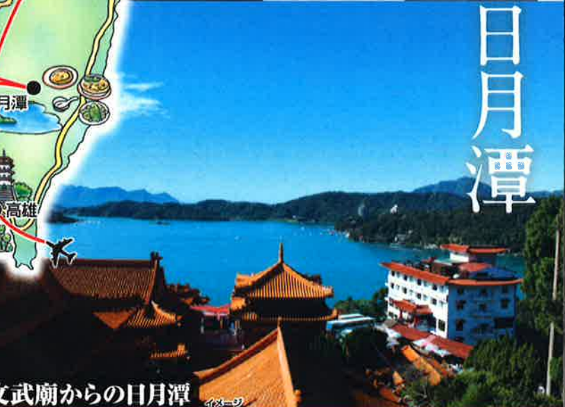
文武廟からの日月潭